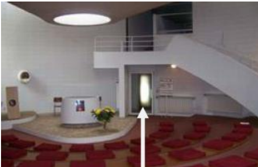
Chapelle Vers la crypte