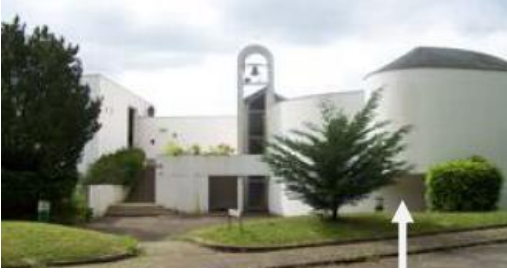
BONNELLES Entrée de la chapelle