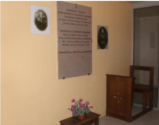
Tombeau des fondateurs

Après avoir fermé notre communauté de Bonnelles, une dernière étape reste à franchir dans le processus de notre retrait définitif du monastère : transférer la sépulture de nos Fondateurs. Nous y avons pensé depuis longtemps et la