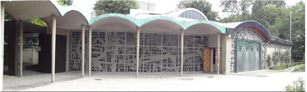
Chemin des pèlerins